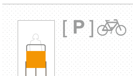
Innermått för dörrar anpassade för platskrävande cyklar.

Cykelparkeringen ska lokaliseras i nära anslutning till entrén så att boende och verksamma i hela fastigheten ges god tillgänglighet. Cykelparkeringen ska vara lokaliserad närmare eller inom samma avstånd från entrén än motsvarande bilparkering, och vara enkel att nå både från gatan och inifrån fastigheten. Cykelparkering som är lokaliserad inomhus ska vara lättillgänglig med så få dörrar som möjligt in till cykelrummet, helst ska det finnas maximalt två dörrar på vägen mellan gatan och cykelparkeringen. Det ska vara en enkel passage från entré till cykelrum (i direkt anslutning eller via hiss/ramp) och dörrar ska vara försedda med automatiska dörröppnare och vara tillräckligt breda (minst 1 meter) för att det ska gå att manövrera en lastcykel. Även ytor för att nå fram till cykelrummen ska vara dimensionerade för lådcyklar vad gäller bredd och svängradie, vilket ställer krav på yttre svängradie på 2,25 meter. Om cykelparkeringen inte ligger i markplan ska den nås via en ramp med maximal lutning 1:12 eller med hiss som är tillräckligt stor för att inrymma lastcykel.